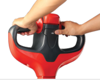
Linde kumanda koluyla ekipman kolayca kumanda edilir.