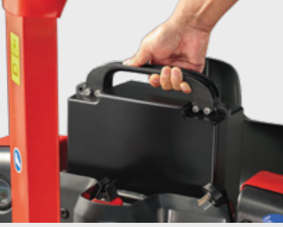
Kolayca yerleştirilip kullanılabilen lityum iyon akü