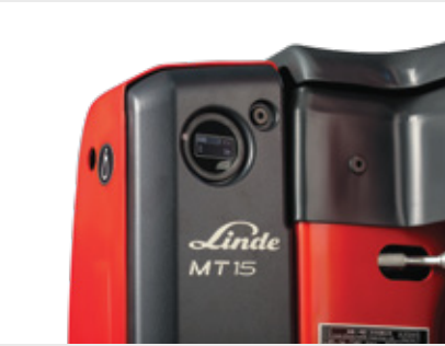
Çok fonksiyonlu bilgi ekranı